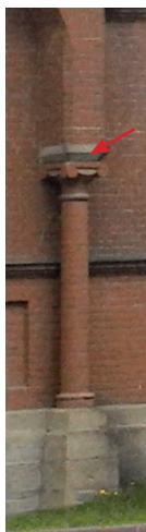
Алое поле, 1

Промежуточный элемент трапецевидной формы между капителью и пятой арки .